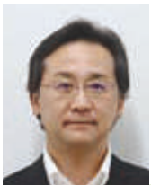
患者相談支援センター センター長