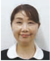
入退院支援センター センター長