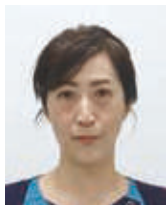
地域医療連携センター センター長